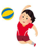
競技：ミニバレーボール

なお、各競技の申込用紙は、北浦総合支所、北浦公民館及び市立図書館北浦分館に置いています。 職場やご近所、スポーツ仲間等でチームをつくり、奮ってご応募ください。