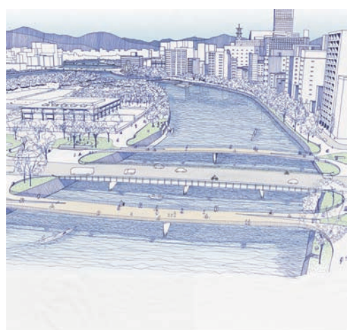
広島県広島市 平和大橋歩道橋デザイン提案競技